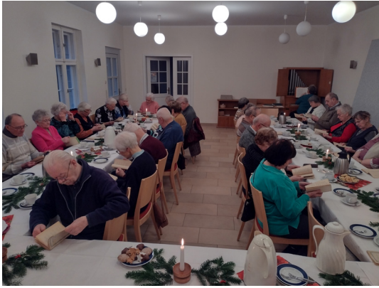
Adventsfeier der Seniorinnen und Senioren