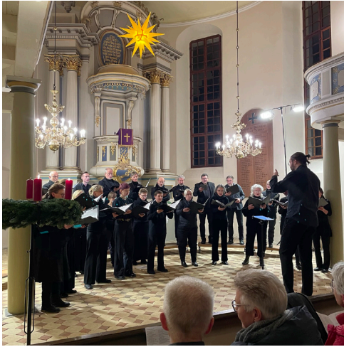
Berliner Vokalkreis: Hochkarätige Chormusik zum Advent mit dem Berliner Vokalkreis erklang am 9. Dezember 2023 in der Biesenthaler Kirche.

Gedenken in Biesenthal: Über 300 Menschen, darunter viele Christinnen und Christen, folgten am 28. Januar dem Aufruf der Initiative „Biesenthal – bunt statt braun“ und versammelten sich in der Breiten Straße und auf dem Biesenthaler Marktplatz zum Gedenken an die systematische Ermordung von Jüdinnen und Juden im deutschen Nationalsozialismus. Auch viele jüdische Einwohner Biesenthals wurden damals verhaftet, deportiert und in Auschwitz und anderen Konzentrationslagern ermordet. So etwas darf nie wieder geschehen. In dieser Weise äußerten sich alle Rednerinnen und Redner. Zum Gedenken gehört darum gleichzeitig das Bewusstmachen unserer gemeinsamen Verantwortung, denn wir alle müssen unsere Stimmen gegen Antisemitismus, gegen jede Form von Ausgrenzung und menschenverachtenden Einstellungen erheben. Wir machen uns stark für ein solidarisches Miteinander und für die Wahrung der Würde eines jeden Menschen.